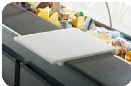
Asse tagliere. Cutting board. Planche à couper. Schneidebrett. Tabla de corte. Доска для резки.