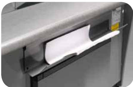
Portacarta. Paper holder. Porte papier. Papiertaschen. Portapapeles. Салфетница.